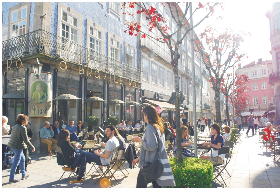
Figura 1 Café A Brasileira, em Braga