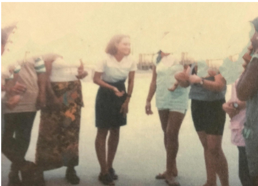
Figura 1 Dinamização / Coordenação do Grupo Socio-Cultural: África Minha