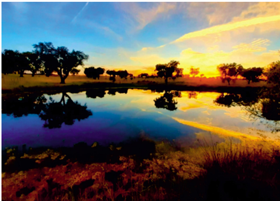
Figura 3 Preservação da Paisagem