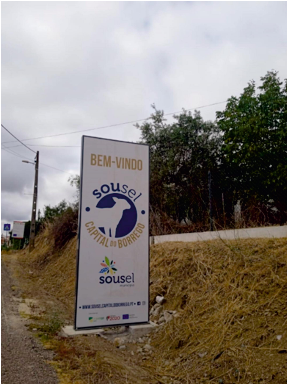
Figura 4 Sousel: "capital do borrego"