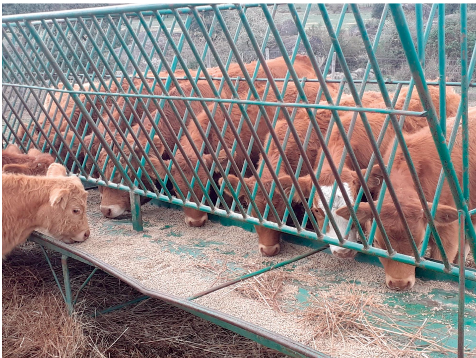
Figura 6 Vitelos em desmame