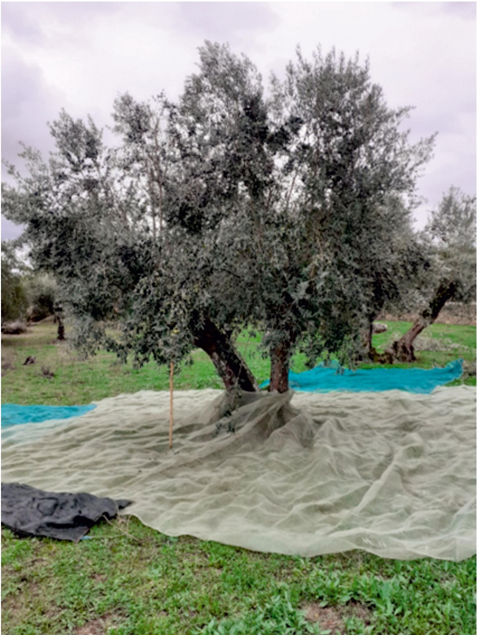
Figura 7 Pastorícia, hortas e oliveiras