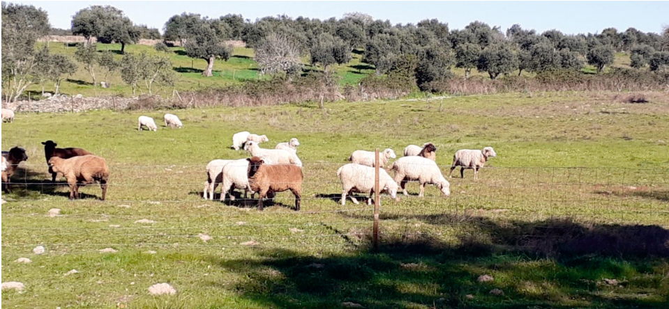
Figura 5 "New pastorícia"