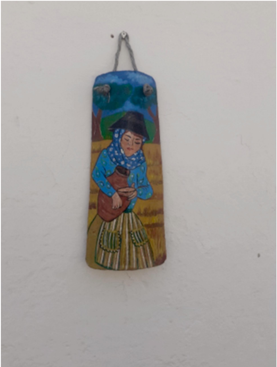
Figura 2 Fotografia "tradições: a ceifeira